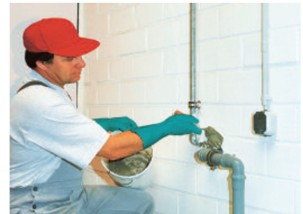
Der Blitz-Zement-Mörtel PCI Polyfix 5 Min. ist leicht zu verarbeiten und nur mit Wasser anzumischen.