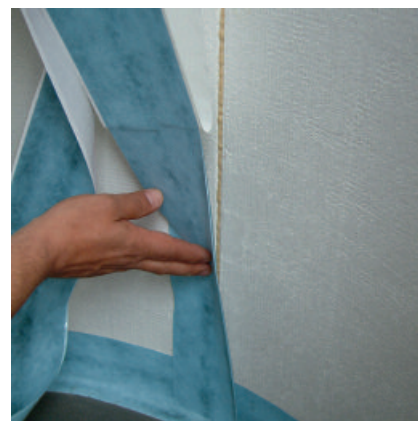
Schutzfolie abziehen und PCI Pecitape WS ohne Vorspannung mit kräftigem Druck aufkleben – fertig!