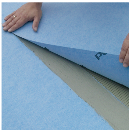
Innerhalb der klebeoffenen Zeit die folgende Bahn einlegen.