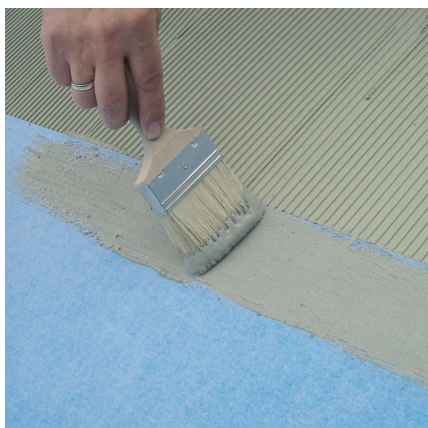
Zum wasserdichten Verkleben der Stöße PCI Seccoral 1K/2K Rapid fehlstellenfrei auf die PCI Pecilastic-W-Bahn aufbringen.

Gipshaltige Untergründe und Gipskartonplatten vorher mit PCI Gisogrund unverdünnt grundieren. Saugfähige mineralische Untergründe mit PCI Gisogrund im Verhältnis 1 : 1 mit Wasser verdünnt grundieren. Trockene, festverschraubte Holzspanplatten mit PCI Wadian grundieren. Die Grundierungen müssen vor dem Aufkleben von PCI Pecilastic W erhärtet sein.