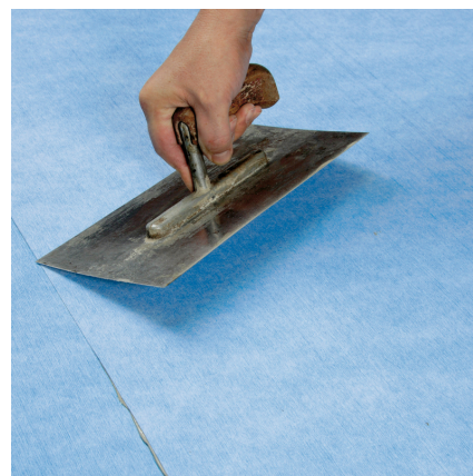
Bahnen mit Traufel, Gummiwalze oder Klopfbrett andrücken.