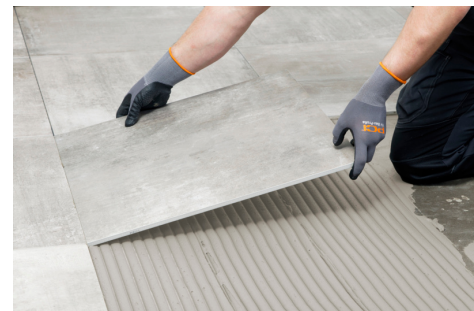
PCI Nanorapid verfügt über eine lange Verarbeitungszeit in Verbindung mit einer punktgenauen schnellen Abbindezeit