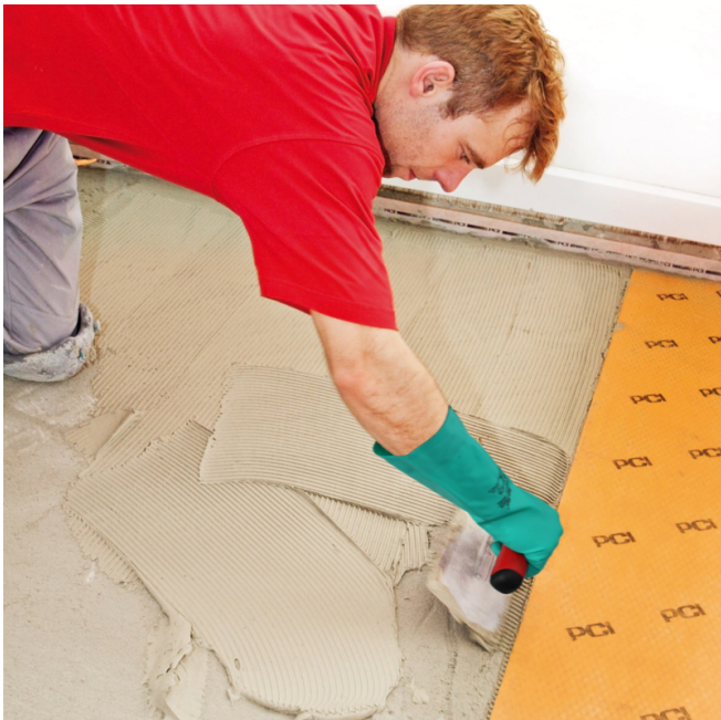
Auf dem vorbereiteten Untergrund PCI Flexmörtel S1 Flott aufkämmen...

Um die verbleibende Restfeuchte unter den PCI Pecilastic U-Bahnen abführen zu können, dürfen in den Randbereichen weder die Randfugen noch die Sockelleisten abgedichtet werden.