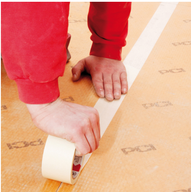
In Trockenbereichen die Stöße mit Kreppband sichern, in Bereichen mit Feuchtigkeitsbelastung mit PCI Pecitape abdichten...