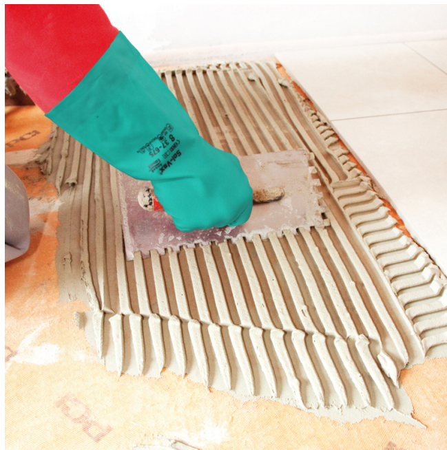
und mittels PCI Flexmörtel S1 Flott den neuen Keramikbelag verlegen.