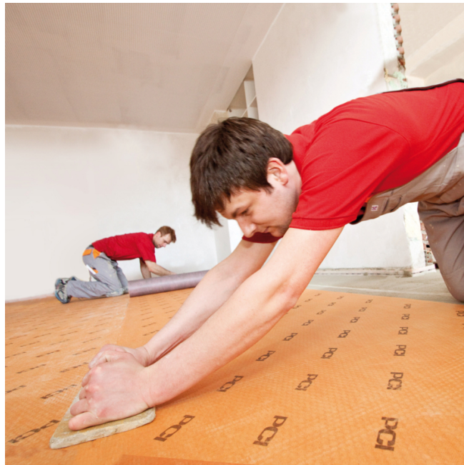
PCI Pecilastic U einlegen und fest andrücken, z. B. mit einem Holzbrett oder Hartgummi-Fugbrett.