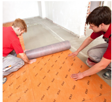
Keramische Beläge können auf der Abdichtungs- und Entkopplungsbahn PCI Pecilastic U funktions-sicher verlegt werden.