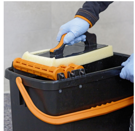
Wichtig dabei ist, dass das Waschwasser in regelmäßigen Abständen (ca. 5 - 10 m 2 ) gewechselt wird.