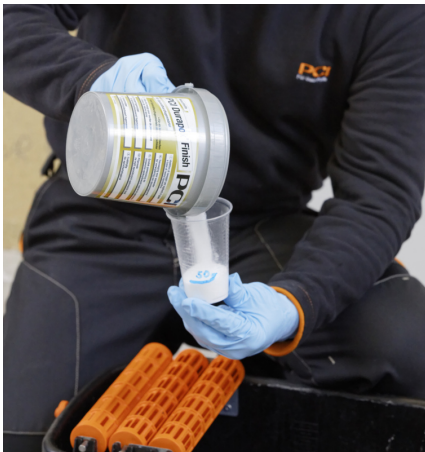
Alternativ kann auch PCI Durapox Finish (Konzentrat) MV 1:100; 5l Wasser: 50 g Durapox Finish; direkt in das Waschwasser hinzugegeben werden.