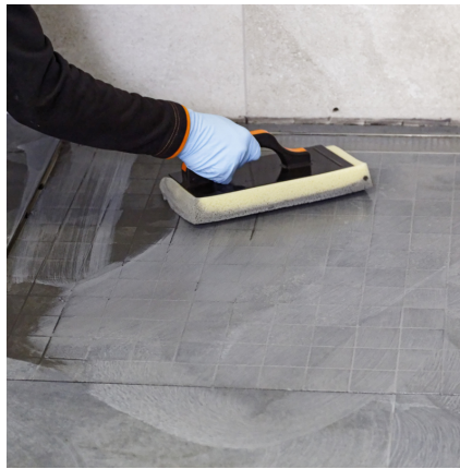
Nach ca. 10 - 45 Min. die eingefugte Fläche mit einem Schwambrett anemulgieren und sauber abwaschen.