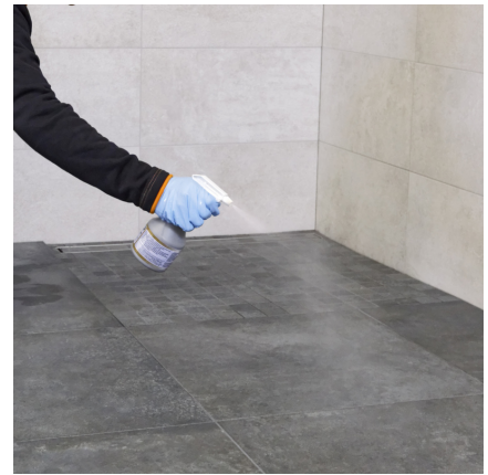
Vor dem finalen Waschgang wird nach ca. 60 Min. PCI Durapox Finish (flüssig) auf die Fläche aufgesprüht.