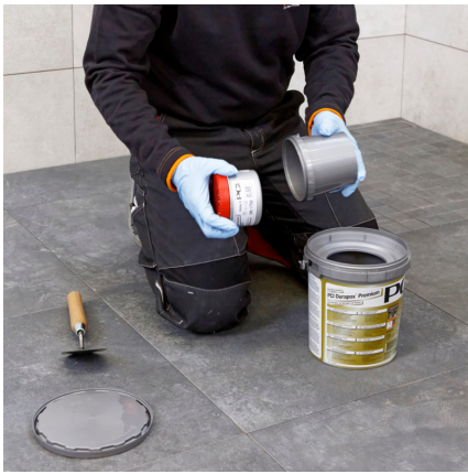
PCI Durapox Premium(Multicolor) (2 kg) öffnen und die zweite Komponente herausnehmen.