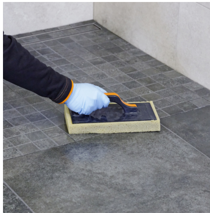
Anschließend mit dem Schwambrett den Restschleier aufnehmen und die Fläche sauber waschen.