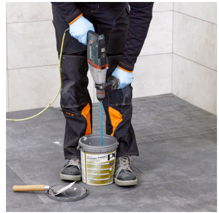
Gründlich Mischen. Um eine homogene Mischung zu gewährleisten, sollte das Gebinde umgetopft und nochmals vermischt werden.