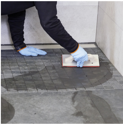
PCI Durapox Premium (Multicolor) mit einer Hartgummifugscheibe in die Fugen einbringen.