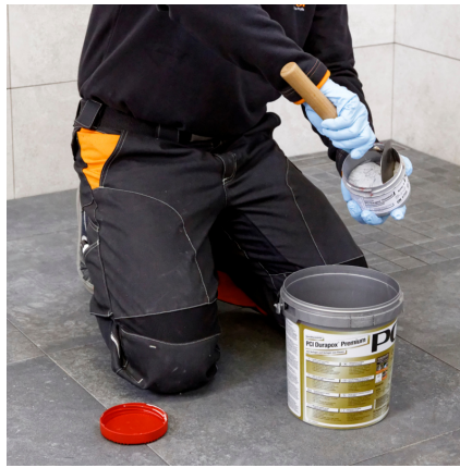
Die Härterkomponente in die Basiskomponente geben.