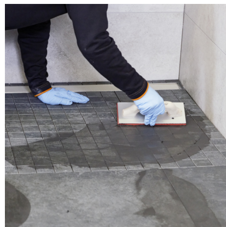
Sehr leichtes Verfugen ohne Restschleier mit PCI Durapox Premium.